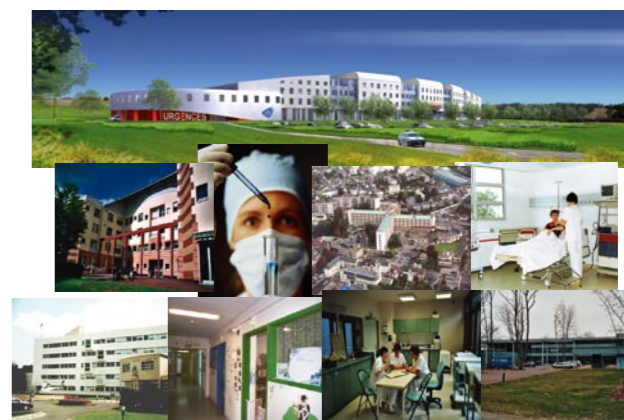
Des hommes et des femmes au service des projets